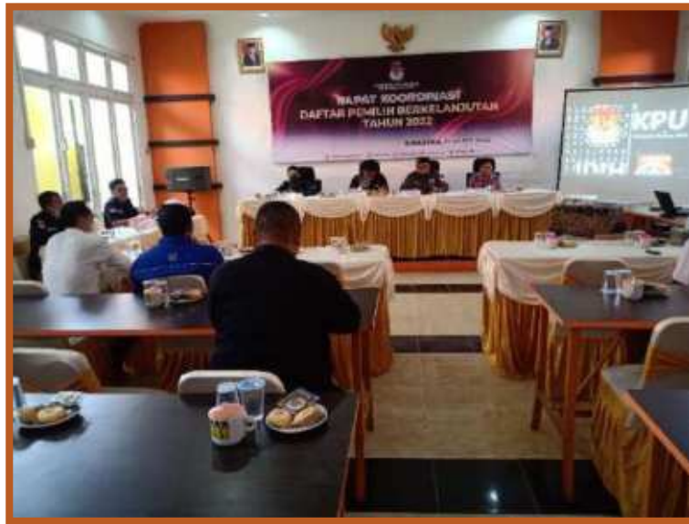
Foto: Rapat Koordinasi DPB Tahun 2022 Triwulan I KPU KKU