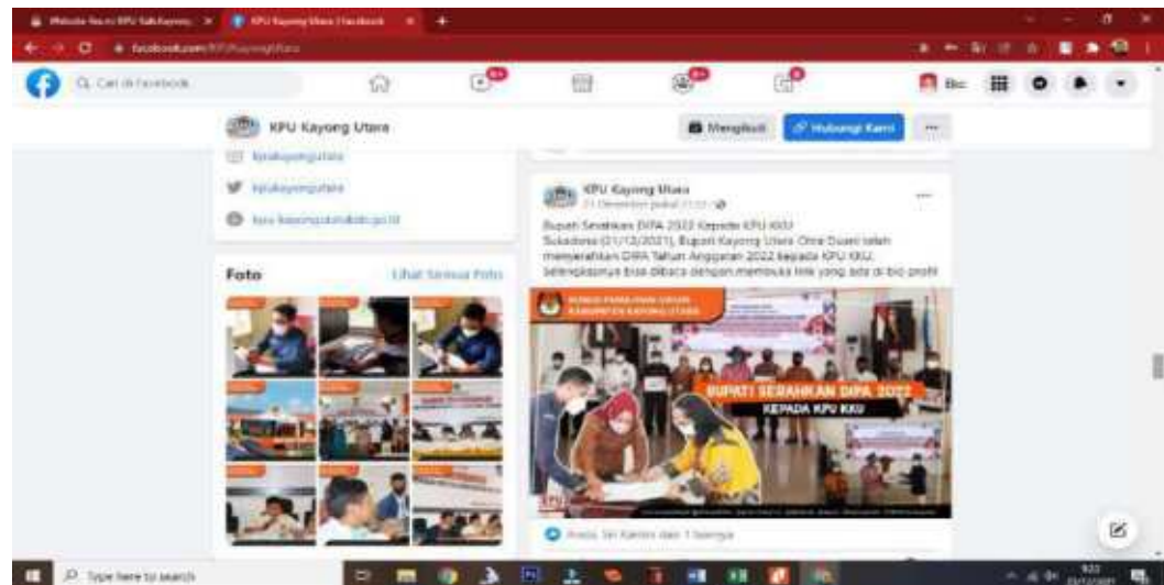
Dokumentasi Screenshot halaman Facebook Official KPU Kayong Utara https://www.facebook.com/ppid.kpu.kku