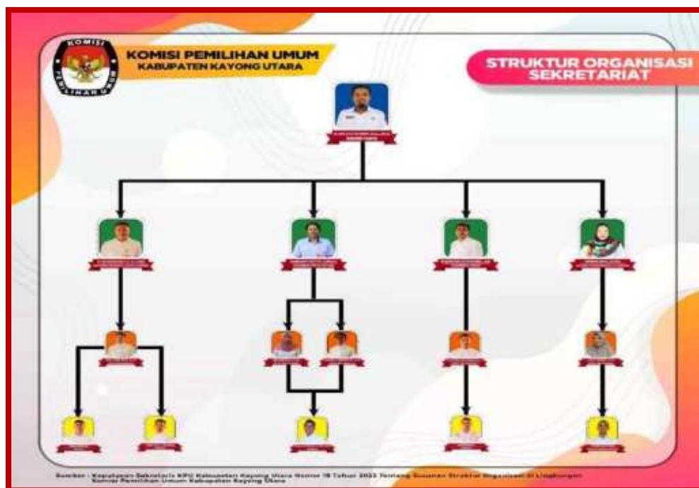
Gambar 2.2 Struktur Organisasi Sekretariat KPU KKU

Dalam menjalankan tugas dan fungsinya Sekretariat KPU Kabupaten Kayong Utara didukung oleh 11 (Sebelas) orang Pegawai Negeri Sipil (PNS), Pegawai Sekretariat KPU Kabupaten/Kota dapat dilihat pada tabel di bawah ini :