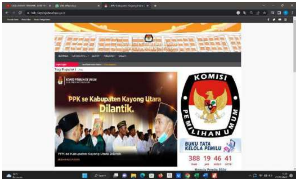
Dokumentasi Screenshot halaman website http://kpu-kayongutarakab.go.id/berita