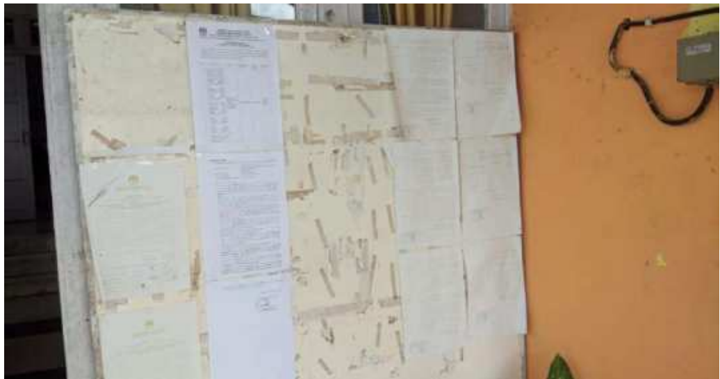
Dokumentasi foto 12 November 2022