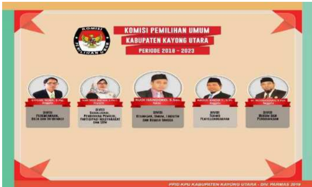
Gambar 2.1 Anggota KPU KKU Periode 2018-2023

Anggota KPU Kabupaten Kayong Utara Periode 2018-2023 sebagai berikut