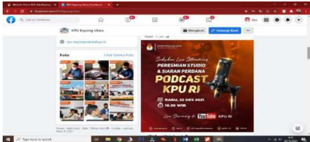
Dokumentasi Screenshot halaman Facebook Official KPU Kayong Utara https://www.facebook.com/ppid.kpu.kku