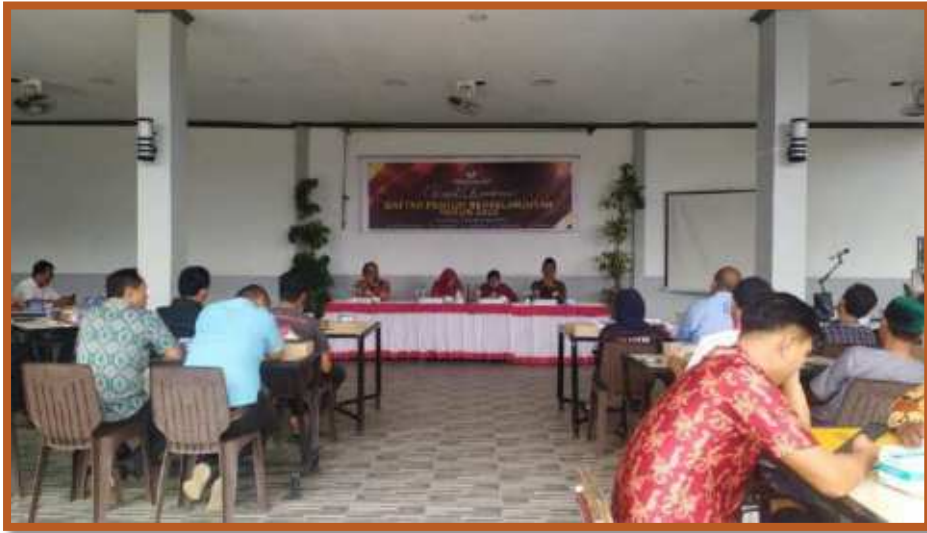
Foto: Rapat Koordinasi DPB Tahun 2022 Triwulan III KPU KCU

III pada Hari Jumat 30 September 2022 dan dituangkan ke dalam BA Nomor: 36/PL.02.1-BA/6111/3/2022.