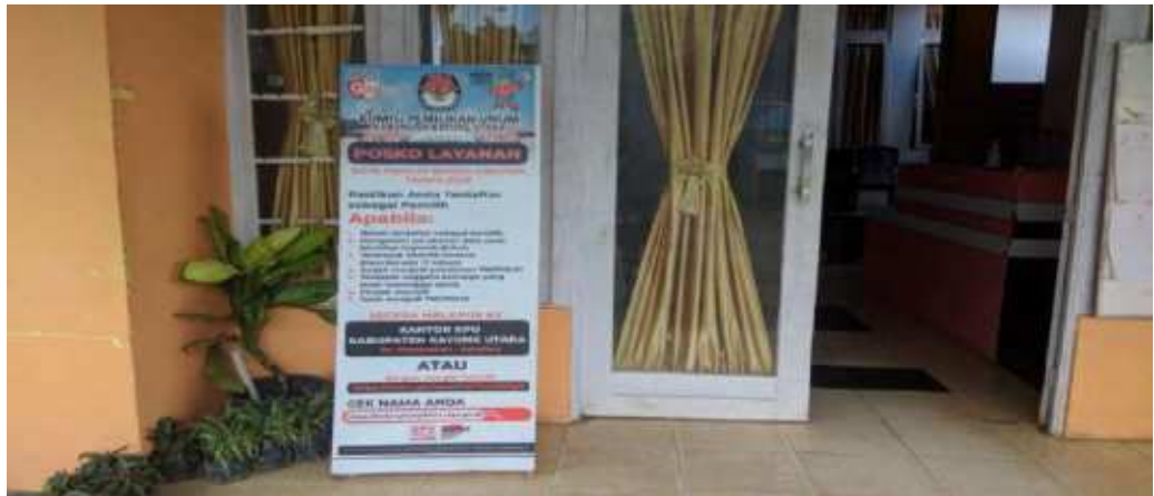
Dokumentasi Foto Posko Layanan DPB Tahun 2020, tanggal 12 November 2022