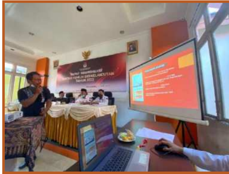
Foto: Rapat Koordinasi DPB Tahun 2022 Triwulan II KPU KKU

DATA ANOMALI: 19 Dan DATA TIDAK PADAN: 6.952. Pada Kamis, 30 Juni 2022 telah dilakukan RAKOR Rekapitulasi DPB Triwulan ke 2 sebanyak 90.132 Pemilih. Dengan rincian Pemilih laki-laki 46.169 dan pemilih perempuan sebanyak 43.963 Pemilih. yang diperoleh dari penambahan pemilih baru sebanyak 89 Pemilih dan TMS pada Periode Bulan Juni 1.801 pemilih, dengan rincian 295 meninggal dunia yang bersumber dari data SIAK yang diturunkan oleh KPU RI, 1.506 TMS ganda yang berasal dari data ganda yang diturunkan oleh KPU RI, dan 120 pemilih perbaikan data yakni perubahan TPS.